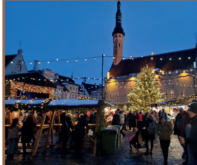
Tallinn - Karácsonyi vásár