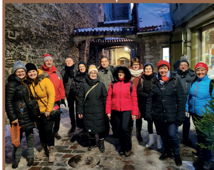
Tallinn - Szent Katalin passzázst