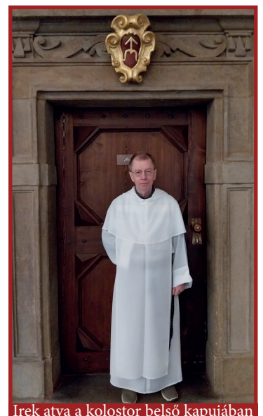
Irek atya a kolostor belső kapujában