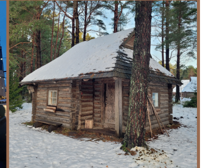
Tallinn - Skanzen