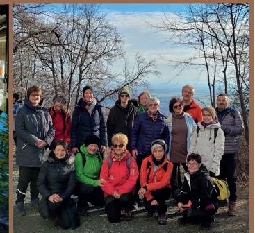
Beigli lejáró túra