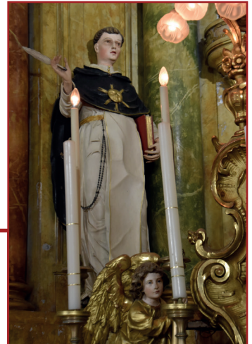
Szent Tamás szobra a főoltáron