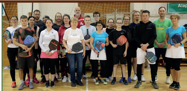
A szombathelyi Vasball játékosai