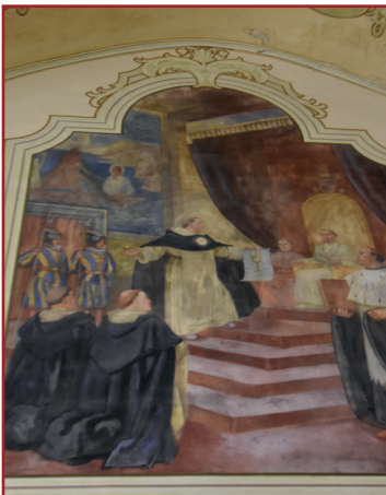
Aquinói Szent Tamás a pápa előtt – falfestmény a vasvári templom szentélyében

mind az egyházi mind a világi – természetesen elsősorban a konzervatív – gondolkodók körében. A tartományfőnök atya kiemelte, hogy Tamás fontosnak tartotta a hit és az értelem (azaz a tudomány) összeegyeztethetőségét, vallotta, hogy Isten megismerése tudományos módszerekkel is lehetséges. Az érdeklődőkkel közösen meghallgattuk Szabó Bertalan atya rövidfilmes előadását Szent Tamásról, amely a Bonum TV Domonkos fáklyavivők c. soroza-