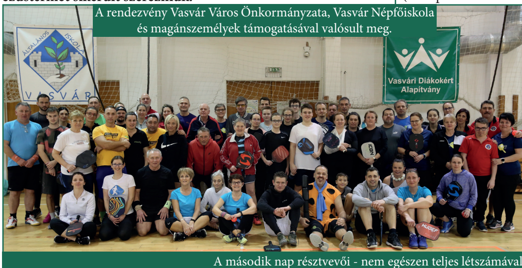
A második nap résztvevői - nem egészen teljes létszámmal

A november végi eseményre több, mint 20 ország nevezését várja az Európai Pickleball Szövetség (European Pickleball Federation).