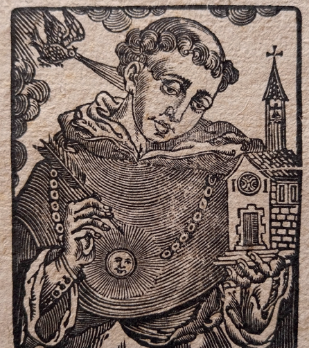
Szent Tamás a Rendtörténeti Gyűjtemény egyik szép fametszetén

A szenteket a középkor óta ún. attribútumokkal, azaz ismertető jegyekkel ábrázolják, amelyek egyértelművé teszik az adott szent személyének azonosítását. Szent Tamás esetében ezek a fekete-fehér domonkos habitus (viselet) mellett elsősorban a könyv és a toll, amelyek tudományos tevékenységére utalnak, valamint a mellkasán (sokszor láncon függve) viselt napkorong, amely egyaránt jelezheti az Isten szeretetét és a lángoló elmét. Festményeken és metszeteken szinte mindig megjelenik Tamás feje felett a Szentlélek jelképe, galamb és néha a könyvön vagy amellel egy templomépület is látható, ami pedig a Tamás által védelt Egyházat szimbolizálja.