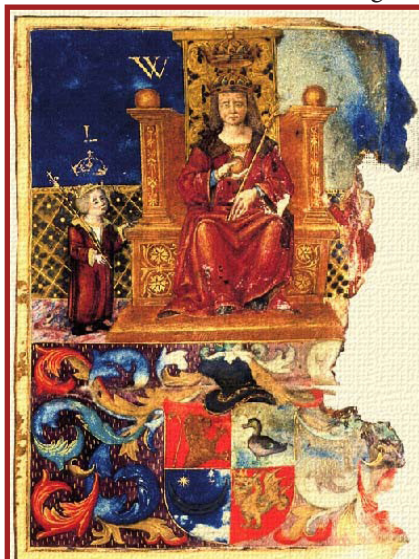
A Pető család címere 1507-ből, a király és a királyi gyermekek alakjaival

A vár erődítéseinek felmérési rajza 1970-ből