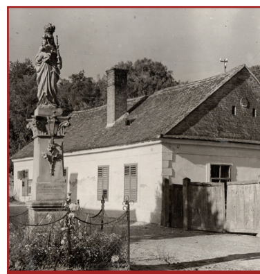
A Mária-szobor egy ötvenes évekbeli felvételen

Sétánk a ma a temető bejáratánál álló Szentháromság-szobornál ért véget, amely több szempontból is fontos a szakrális emlékek sorában: egyrészt egykor a város főterén állt, másrészt talán ez lehetett az első a kőszoborok sorában, amelyek lassan felváltották a korábban is nagy számban álló fakereszteket. (Lásd erről kerete írásunkat!)