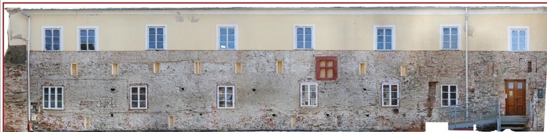
A nyugati szárny homlokzata a kutatás idején (fotómontázs)