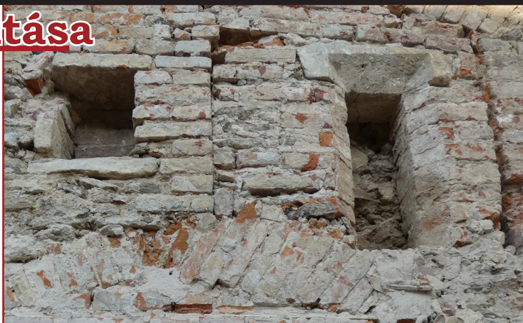
Különböző korszakok nyílásai a kolostor falán

Az erős falnedvesedés indokolta a teljes vakolat elváltatását, így most újabb részletek kerültek napvilágra.